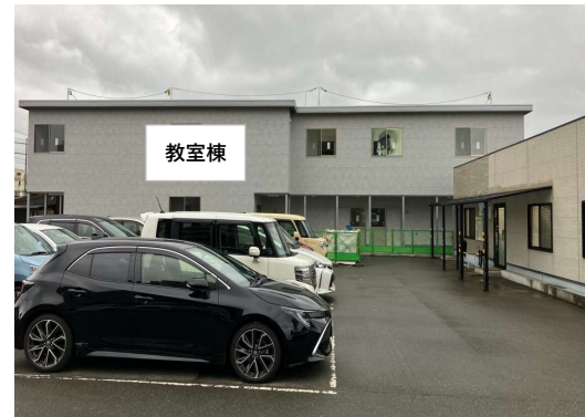
⑨ 教習センターに到着です 教室で受付を行いますので、直接教室へお入りください