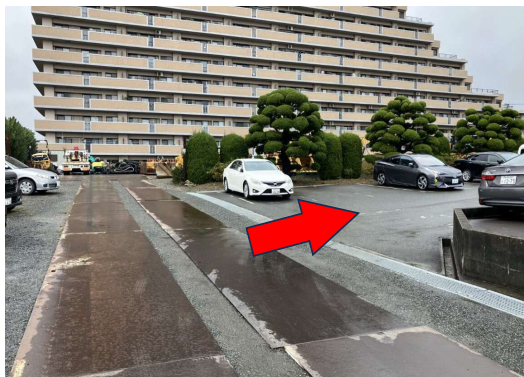
⑧ 右側に駐車場があります