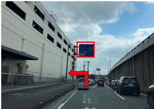
② 次の信号を「日田・朝倉」方面へ左折してください