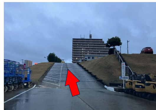
⑥ 左手の坂を登ってください