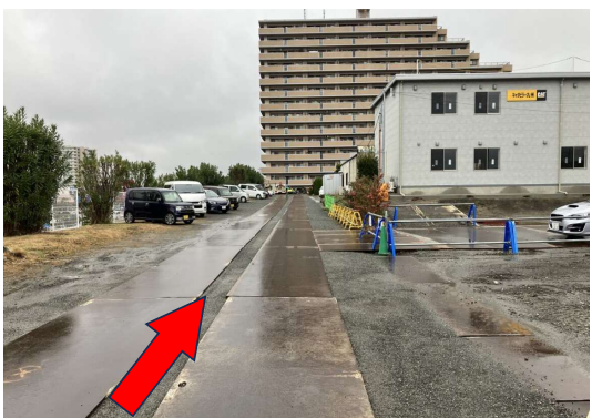
⑦ まっすぐお進みください