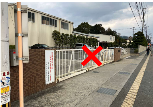
④ 郵便局前の門からは入れません