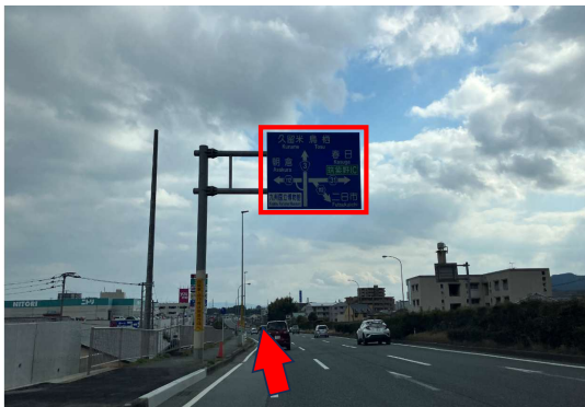
① 国道3号線を南進し「高雄交差点」通過後、一番左側の車線を斜め左に「朝倉」方面へお進みください