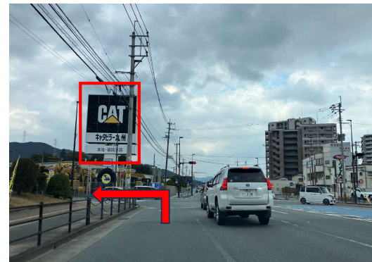
③ 左折後、すぐ次の信号「CAT看板の手前」を左折してください